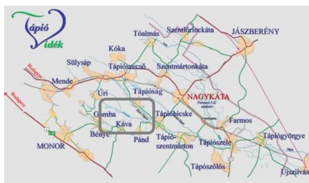
1. kép - Tápióság földrajzi elhelyezkedése

sz. főútról lehetséges. Budapestről tömegközlekedéssel 60 perc alatt, autóval 50 perc alatt lehet a településre érni.